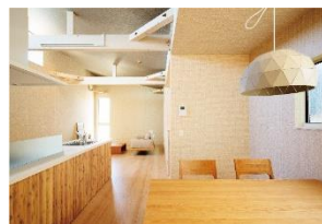
3 木のやさしい質感が心地よいLDK