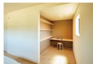
2 個人の時間に活用できるワーク スペース