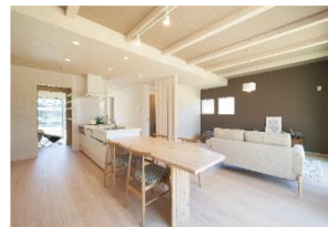
1 リビングや土間コーナーの中心に配置したダイニングキッチン