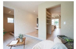
2 動線に優れた多目的に活用できる土間コーナー