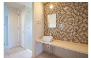
4 手洗いコーナーのタイルはインテリアのアクセントにも