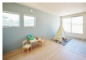
1 家族キャンプやDIYにおすすめの 土間空間